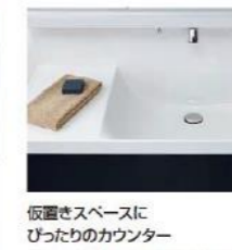
仮置きスペースにぴったりのカウンター。広々とした大開口の洗面ボウルながら、化粧品などを一時置きできるスペースを設けています。