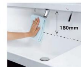
ミラー下まであるハイバックガード。バックガードと洗面ボウルが一体成形。つなぎ目がなく、水ハネも簡単に拭き取れます。