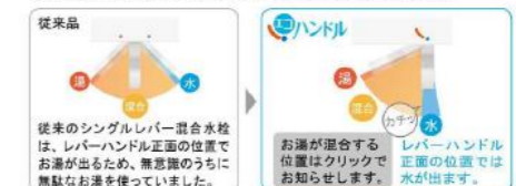
従来のシングルレバー混合水栓は、レバーハンドル正面の位置でお湯が出るため、無意識のうちに無駄なお湯を使っていました。