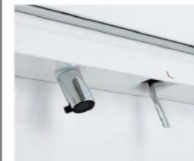
上からの吐水だと水栓まわりに水がたまるのでお掃除簡単です。

キレイアップ水栓は、水栓まわりに水がたまることのないので、拭き掃除の手間がほとんどありません。また、高さ18cmのバックガードがミラー下まであり、つなぎ目などの凹凸がなくサッとひと拭きでお手入れできます。