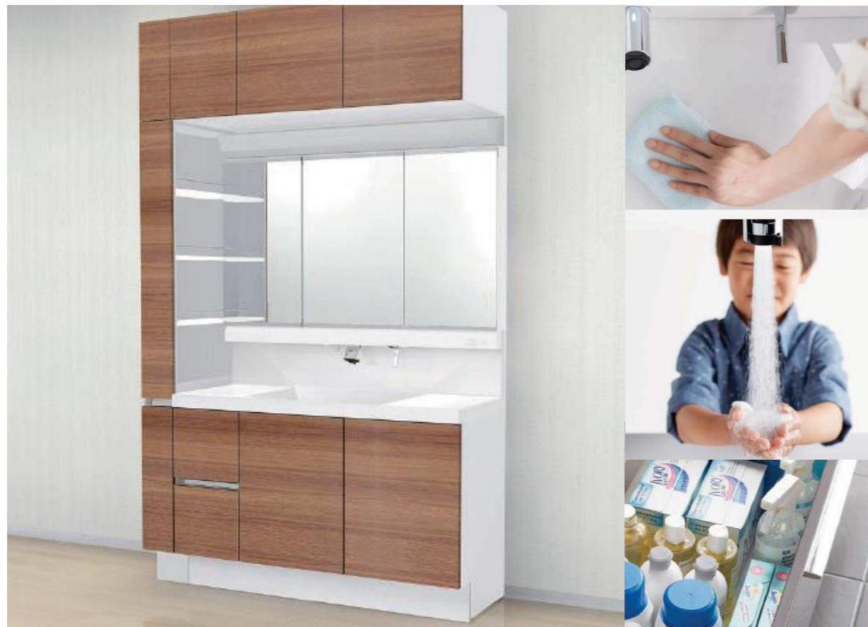
化粧台本体 (引出タイプ)