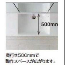
奥行き500mmで動作スペースが広がります。奥行きが500mmとコンパクトだから、動作スペースを広げることができます。洗濯などの作業人の行き来などが楽になります。