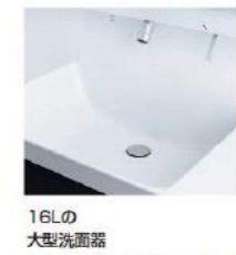
16Lの大型洗面器。洗面ボウルの容量は16Lを確保しながら、コンパクトな奥行きを実現しています。