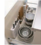
■シンクキャビネット ・包丁差し ・ラップホルダー ・ワイヤーバスケット